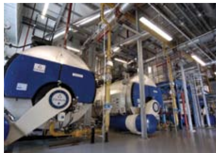
Szpital w Birmingham Heartlands

Oprócz rozwiązań kompleksowych możemy proponować pełny zakres usług pomocniczych, które umożliwiają klientom przeniesienie ryzyka związanego z eksploatacją instalacji na podmiot zewnętrzny.