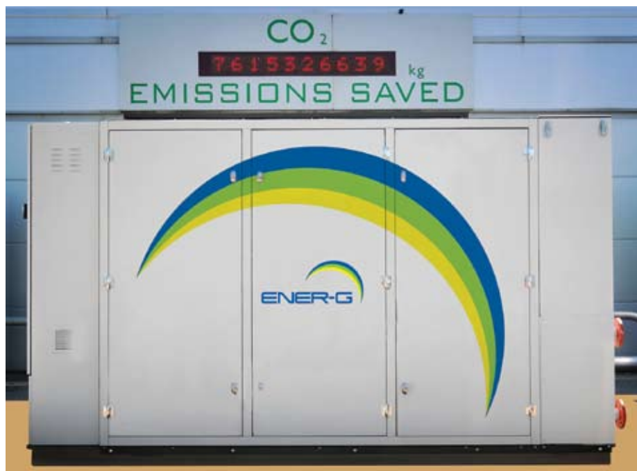
70kWe ENER-G CHP